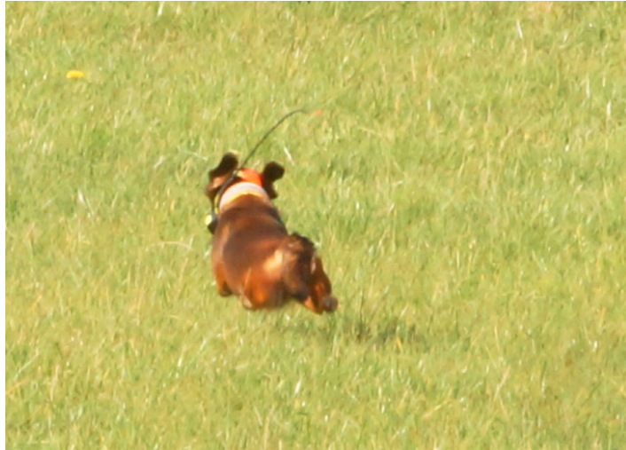
In voller Fahrt dem Opfer der Begierde hinterher