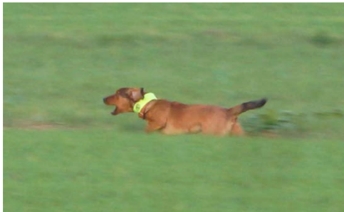
Laut hinterm Hasen hinterher