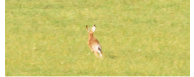
Der Hase sucht sein Heil in der Flucht