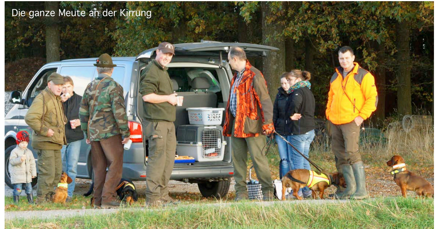
Die ganze Meute an der Kirmung