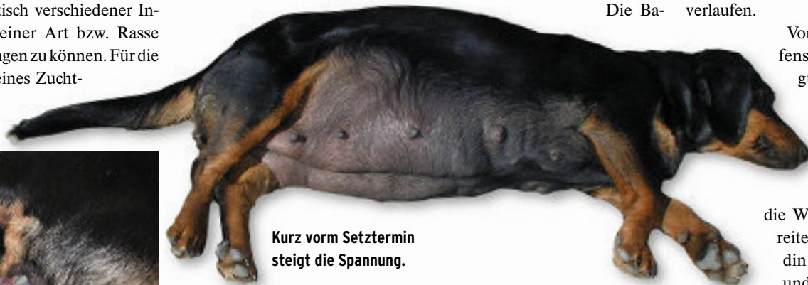
Kurz vorm Setztermin steigt die Spannung.

Das Werfen einer instinktsicheren Hündin ist ein wunderbares Erlebnis. Sie weiß genau, was zu tun ist, befreit die Neugeborenen aus der Fruchtblase, nabelt sie ab und beleckt sie, um sie zu trocknen und den Kreislauf anzuregen. Der Züchter erhält bei genauer Beobachtung direkt nach dem Werfen wertvolle Hinweise über die Vitalität der Kleinen (Stichwort Biotonus). Welpen mit