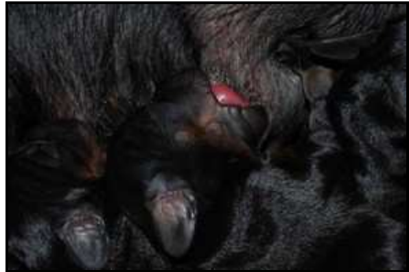
Lohn der Anstrengung: Erreichen von Wärme bzw. der mütterlichen Zitze als Nahrungsquelle