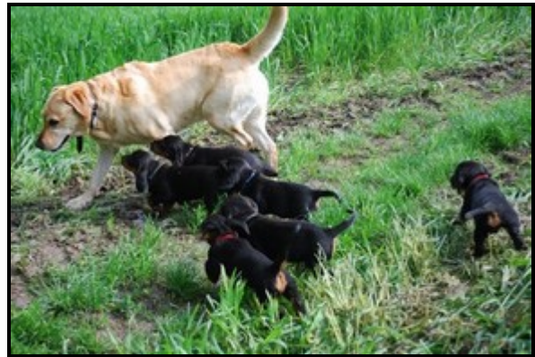
Prägung: Zwischenartlich auf den Menschen und innerartlich auf den Hund

Im Hinblick auf den späteren Einsatz als Jagdhund ist den Dachsbrackewelpen ab dem Alter von fünf bis sechs Wochen Futter vorzulegen, an dem sie das Reißen und Totschütteln einüben können. Zu diesem Zweck bieten sich ergänzend zu einem hochwertigen Fertigfutter z. B. Rinderherz oder -pansen an. Die Hunde lernen so, größere Futterbrocken zu zerlegen, und ihr Verdauungssystem stellt sich auf Rohfutter ein. Außerdem werden Elemente des Beutefangverhaltens eingeübt.