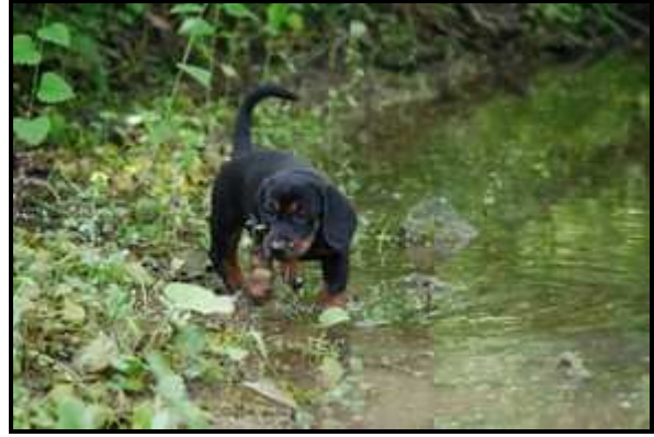
Ausflug in die Natur mit der Mutterhündin und frühe Heranführung an das Wasser