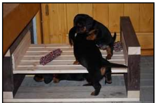
Lerngeräte: Balancierkreisel mit innenliegender Metallkugel (wippt, dreht sich und macht Geräusche) sowie federnd aufgehängenes Podest mit Kleinspielzeug

Der Züchter muss dafür Sorge tragen, dass die jungen Dachshunden bei allen Aktivitäten innerhalb und außerhalb des Zwingers nicht ernstlich verunfallen können. Auch Negativelebnisse sind prägend. Die Welpen dürfen deshalb mit dem Umfang oder der Intensität dessen, was sie verarbeiten sollen, weder körperlich noch seelisch überfordert werden.