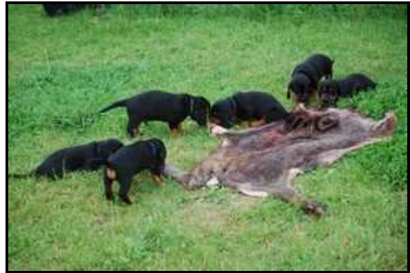
Objektprägung auf das Jagdwild – Hase an der Schleppe und Sauschwarte

Natürlicher Boden prägt die Welpen darauf, sich hier zu lösen, was die Erziehung zur Stubenreinheit erheblich erleichtert. Lerngeräte wie Balancierkarussell, Wippe, Röhren oder schwingende Podeste fördern die Selbstsicherheit und motorischen Fähigkeiten der jungen Dachshunden. Auch kleinere Spielsachen wie Holzbälle, dicke Tauenden, Rasseln, Aststücke etc. kommen zum Einsatz. Mit entsprechend platzierten, dicht belaubten oder benadelten Ästen lässt sich eine Art „Dickungssituation“ (eng, dunkel) im Auslauf simulieren. Die Welpen sollten möglichst viel Gelegenheit haben, den Zwinger zu verlassen. In den häuslich-familiären Bereich gehört die Prägung auf die Dinge des alltäglichen Lebens wie z. B. Staubsauger, Rasenmäher, glatten Fliesenboden oder Treppen. Ab der sechsten Woche sollten Ausflüge der Mutterhündin mit ihrem Wurf in das Revier geboten werden, wobei gleich die Gewöhnung an das Autofahren erfolgt, die in der Gruppe leichter fällt. Im Revier lernen die Hunde die verschiedenen Biotopverhältnisse mit all ihren Eigenarten im Schutz des Rudels kennen. Dadurch werden sowohl die motorische wie auch die wesensmäßige Reifung weiter gefördert.