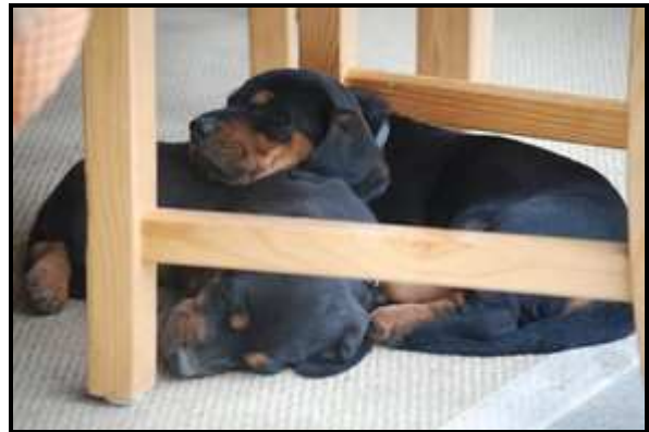
Sozialisierung auf Kinder und Gewöhnung an das häusliche Umfeld beim Züchter

Aus dieser Situation erwachsen für den Welpenerwerber, der den Hund übernommen hat, verschiedene Anforderungen. Um spätere Unterordnungsprobleme zu vermeiden, ist es erforderlich, im ausgedehnten, einfühlsamen Spiel mit dem Dachsbrackewelpen dessen Vertrauen zu gewinnen, um darauf aufbauend die Vorrangstellung des Menschen zu entwickeln. Der Führer muss dem jungen Hund ab der zwölften Lebenswoche als authentische, uneingeschränkte Autorität gelten. In diesem Zusammenhang ist ihm die Beißhemmung gegenüber Personen zu vermitteln. Er muss außerdem die Erfahrung machen, dass es nichts Schlimmes ist, wenn sein Führer ihm den Fang öffnet, das Futter wegnimmt, das Fell nach Zecken absucht, ihn mit einem Zollstock vermisst oder andere „Manipulationen“ vornimmt. Wichtig ist auch, den Welpen positiv auf den direkten Blickkontakt mit seinem Führer einzustellen. Dabei geht es immer um die altersgerechte, aber konsequente Vermittlung sozialer Grundlagen, nicht um „Erziehung“ mit überfordernden Praktiken, die im Sozialisierungsalter schwere Wesensmängel hervorrufen können.