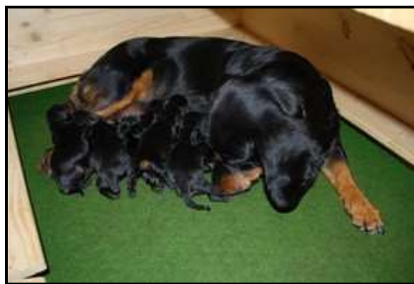
Mutterhündin mit Welpen in zweckmäßiger Wurfkiste

Die instinktsichere Dachshundhündin meistert die Geburt sowie die Betreuung ihrer Welpen während der Neugeborenenphase alleine. Eingriffe des Züchters in das natürliche Wurfgeschehen drängen die Hündin in die Defensive, d. h. sie hemmen deren Kontakt zu den Welpen. Die instinktsichere Hündin säugt die Kleinen, regt durch Belecken die Verdauung an, nimmt die Exkremente auf, reguliert die Temperatur des „Welpenhaufens“ und sorgt dafür, dass kein Sprössling aus dem Wurflager fällt. Die Welpen können nur dann eine emotionale Bindung an die Mutter entwickeln, wenn diese über sichere Brutpflegeinstinkte verfügt. Diese Bindung ist wiederum die Basis für die nötige Selbstsicherheit der Welpen, um ihre Umwelt Stück für Stück zu erkunden. Entsprechender Wert ist auf das Wesen von Hündinnen bei der Zuchtzulassung zu legen.