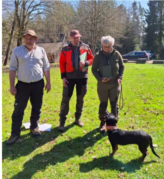
Das Prüfungssiegergespann mit einem 2ten Preis.